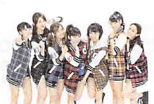
公式応援団 アップアップガールズ(仮)