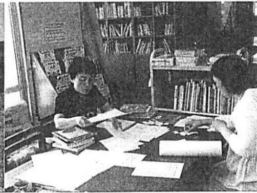
高松小学校図書ボランティア